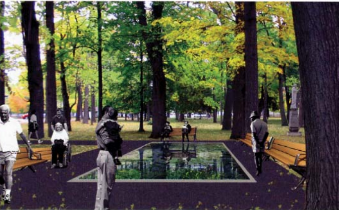
Chambre verte, jardin prothétique pour le CHSLD l'Ermitage à Victoriaville.