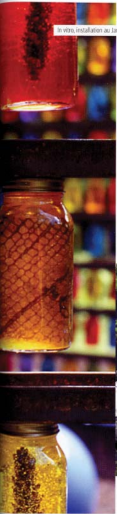
In vitro, installation au Jardin de Métis.