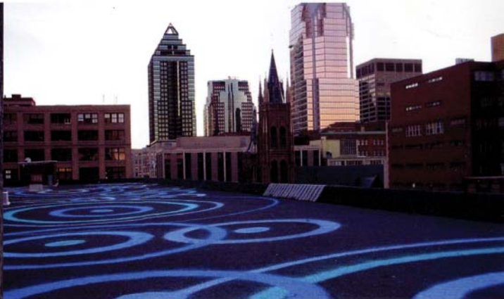
Impluvium, une exploration induite par le potentiel inexploité des toits et de l'eau douce. Bourse du conseil des arts et des lettres du Québec.